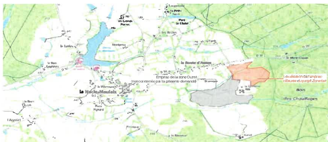
Figure 1 Zones concernées par les permis, en gris pour l'Ouest et en rouge pour l'Est