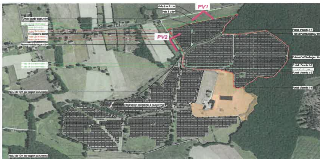
Figure 3: Permis modifié déposé en 2024