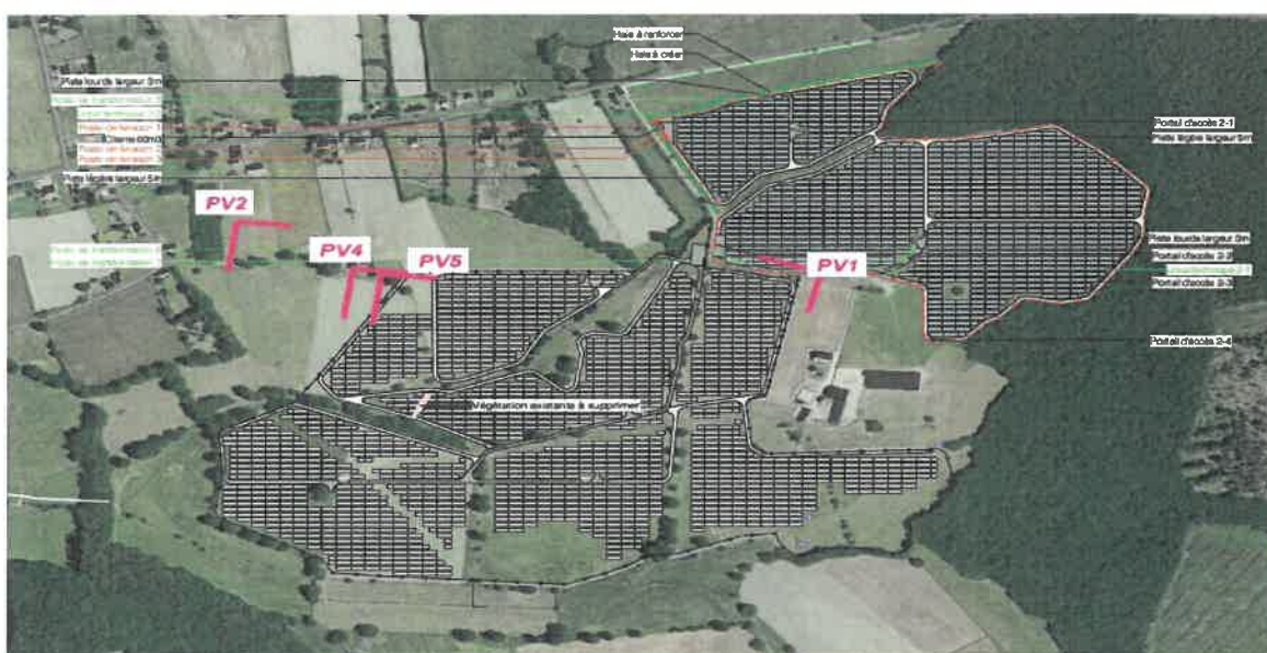
Figure 2: Permis initialement déposé en 2023